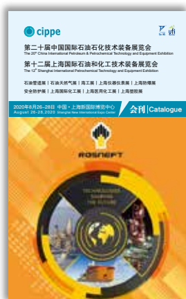
封面 Front Cover