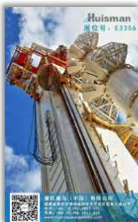
封底 Back Cover