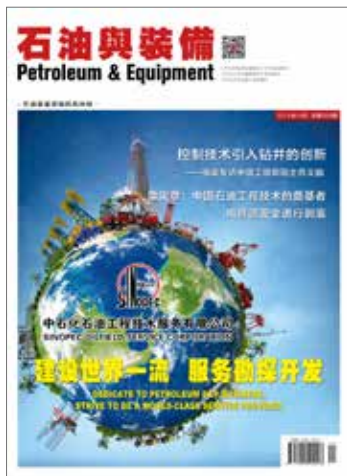
封面 Front Cover

Petroleum & Equipment (Official website: www.shiyouyuzhuangbei.com ) is a professional comprehensive journal of petroleum equipment industry ("Database for Chinese Technical Periodicals" Periodical Full-text, Journals Collected by China Petroleum Literature Databases), The cippe promotional magazine specified. New technology, new arts & crafts, new products and new conceptions of the petroleum & equipment industry are reported in the magazine, which provides an information exchanging platform for petroleum equipment manufacturers and oil producing enterprises. It was published over 30,000 hits per two month, issued bimonthly for public distribution both at home and abroad, printed on full-color copper sextodecimo papers, with main target readers such as top managers, decision makers, technological and purchasing personnel of petroleum & equipment industry, covering oil fields, engineering companies, petrochemical companies, scientific research institutes and equipment manufacturing companies etc. The International Standard Serial Number is ISSN 1001-9960.