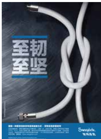
封底 Back Cover