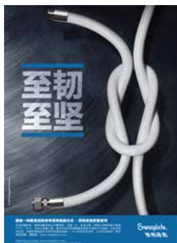
封底 Back Cover