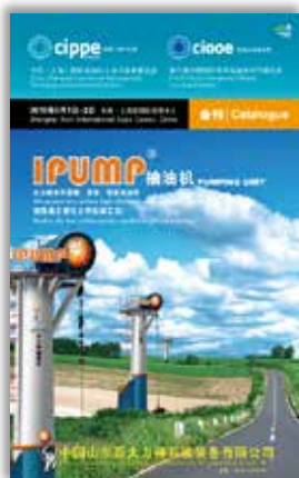
封面 Front Cover