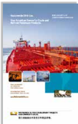
封底 Back Cover