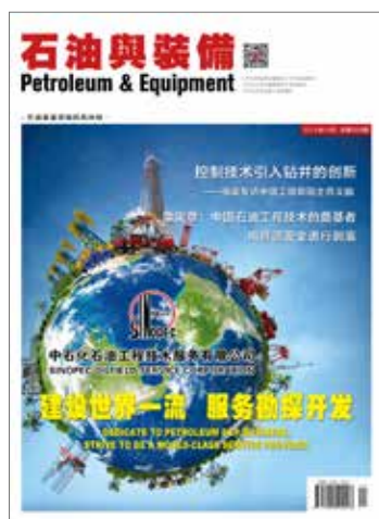
封面 Front Cover

Petroleum & Equipment (Official website: www.shiyouyuzhuangbei.com ) is a professional comprehensive journal of petroleum equipment industry ("Database for Chinese Technical Periodicals" Periodical Full-text, Journals Collected by China Petroleum Literature Databases), The cippe promotional magazine specified. New technology, new arts & crafts, new products and new conceptions of the petroleum & equipment industry are reported in the magazine, which provides an information exchanging platform for petroleum equipment manufacturers and oil producing enterprises. It was published over 30,000 hits per two month, issued bimonthly for public distribution both at home and abroad, printed on full-color copper sextodecimo papers, with main target readers such as top managers, decision makers, technological and purchasing personnel of petroleum & equipment industry, covering oil fields, engineering companies, petrochemical companies, scientific research institutes and equipment manufacturing companies etc. The International Standard Serial Number is ISSN 1001-9960.